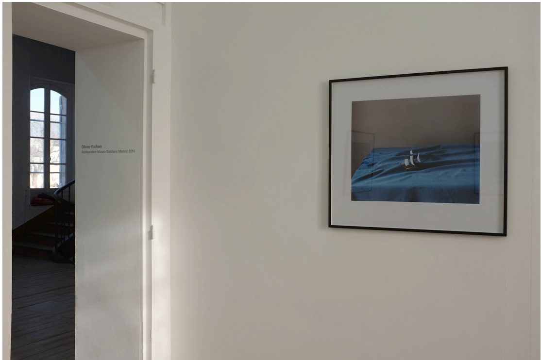
Oliver Richon Restauration Museo Galiano Marché 2010